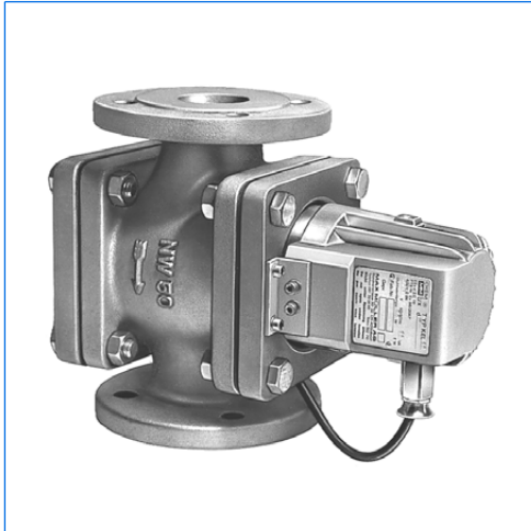
Durchfluss-Schauglasarmatur, Typ FDE 50, mit angebauter Schauglasleuchte, Typ FKEL 5 dH WM, Ex d IIC T6 Gb, Ex t IIIC T80°C Db IP67, Ex II 2 G + D, 230 V, 5 W, mit Opalglas «M»