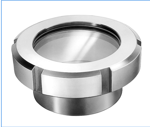
Schraub-Schauglas zum Einschweissen, Typ SSA 100