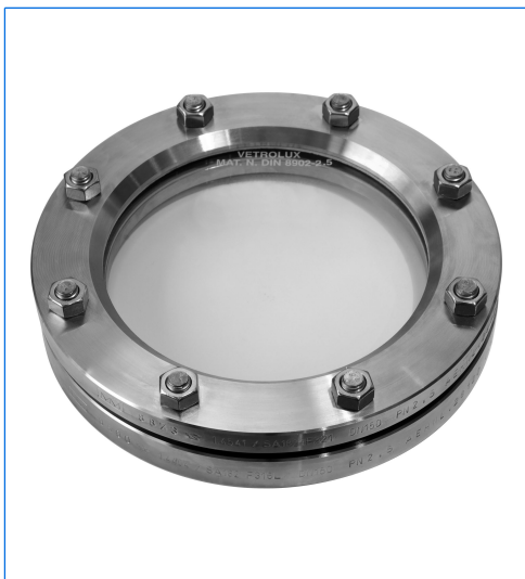
Runde Schauglasarmatur ähnlich DIN 28120, DN 150, PN 2,5, mit thermisch vorgespannter Natronkalkglasscheibe nach DIN 8902