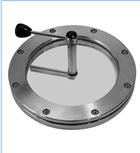
Runde Schauglasarmatur, DN 150, PN 0, mit thermisch vorgespannter Natronkalkglasscheibe nach DIN 8902, mit eingebautem Scheibenwischer, Baureihe W, Wischblatt Silikon