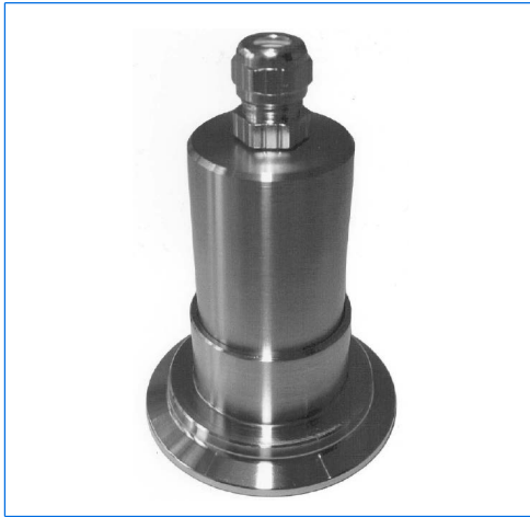
Micro-LED-Schauglasleuchte, Typ MVLR 2 LED, 2 W, 24 V AC/DC, auf metallverschmolzenem Schauglas für Triclamp® Klemmverbindungen, DN 50, PN 16