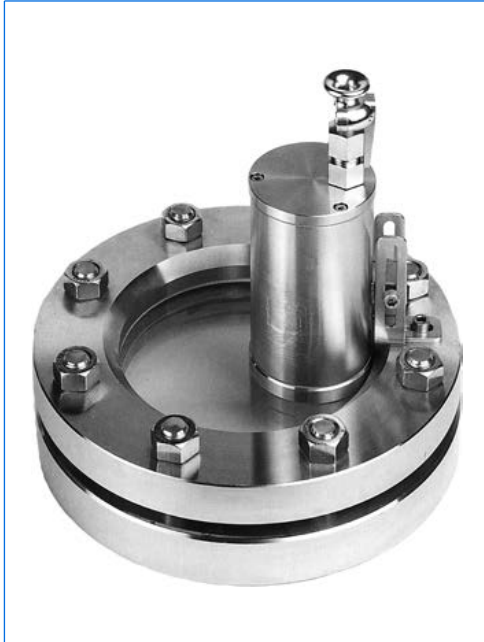
Projecteur type EdelEx 20 dH Sch K1, 20 W, 24 V, Ex d IIC T4 Gb, Ex t IIIC T130°C Db IP67, Ex II 2 G + D, avec fixation de charnière «Sch» sur hublot rond selon DIN 28120, PN 10, DN 125.