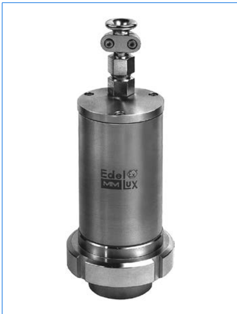
Projecteur type EdelEx 10 dH R50 K1, 10 W, 230 V, Ex d IIC T4 Gb, Ex t IIIC T130°C Db IP67, Ex II 2 G + D, avec fixation par disque à col étiré «R» sur hublot à visser similaire à DIN 11851, PN 6, DN 50.

Avec la gamme EdelEx, MAX MÜLLER S.A. présente le premier projecteur adf en Europe entièrement en acier inoxydable . Un produit de haute performance que vous, constructeur ou utilisateur d'appareils en INOX, avez attendu depuis des années! Mis à part son design sans compromis et la qualité réputée des produits de fabrication MAX MÜLLER S.A., les projecteurs de la gamme EdelEx vous offrent les principaux avantages suivants: