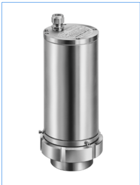
Projecteur type EdelEx G20 dH R80 K1, 20 W, 230 V, Ex d IIC T5 Gb, Ex t IIIC T95°C Db IP67, Ex II 2 G + D, avec fixation par disque à col étiré «R 80» sur hublot vissé similaire à DIN 11851, PN 6, DN 80.

Avec la gamme EdelEx G20 dH / 50 dH, MAX MÜLLER S.A. présente un produit de haute performance que vous, constructeur ou utilisateur d'appareils en INOX, avez attendu depuis des années! Mis à part son design sans compromis et la qualité réputée des produits de fabrication MAX MÜLLER S.A., les projecteurs de la gamme EdelEx vous offrent les principaux avantages suivants: