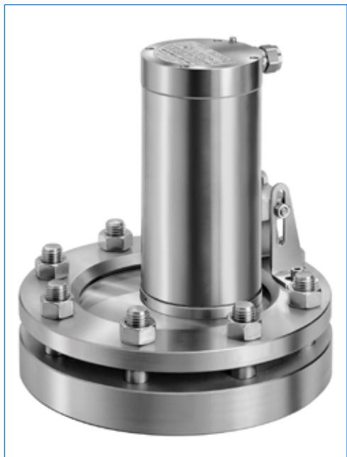
Projecteur type EdelEx 50 dH Sch K2, 50 W, 230 V, Ex d IIC T4 Gb, Ex t IIIC T130°C Db IP67, Ex II 2 G + D, avec fixation par charnière «Sch» sur hublot rond selon DIN 28120, PN 10, DN 150.