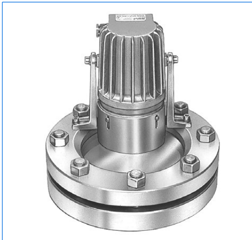
Ensemble éclairant-voyant VETROLUX, se composant d'un hublot selon DIN 28120, DN 150, PN 10, avec projecteur CHEMLUX, type KEL 20 deH Sch B, 230 V, 20 W, Ex d e IIC T4 Gb, Ex t IIIC T130°C Db IP67, Ex II 2 G + D, avec pare-reflets «B», en version «vue et éclairage par un seul hublot»