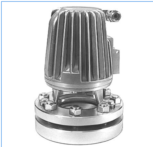
Ensemble éclairant-voyant VETROLUX, se composant d'un hublot selon DIN 28120, DN 80, PN 10, avec projecteur CHEMLUX, type F 20dHNsp, 24 V, 20 W, Ex d IIC T5 Gb, Ex t IIIC T95°C Db IP 67, Ex II 2 G + D

Le tableau ci-dessous indique les possibilités de combinaison standard de nos types de projecteurs avec les diamètres nominaux des hublots selon DIN 28120 / 28121: