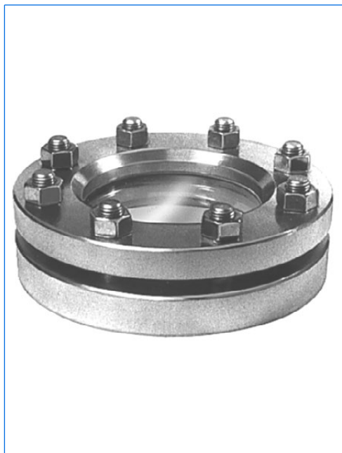
Hublot rond selon DIN 28120, DN 100, PN 10, verre en silicate de bore selon DIN 7080.

En complément de son programme de projecteurs bien connu, MAX MÜLLER S.A. vous propose également des hublots ronds selon et similaires à DIN 28120 et selon DIN 28121. Ces hublots, couplés avec nos projecteurs CHEMLUX, EdelLUX, fibroLUX, miniLUX ou metaLUX, constituent des ensembles éclairants-voyants VETROLUX que nous mettons à votre disposition en set prémonté. Les avantages sont clairs: