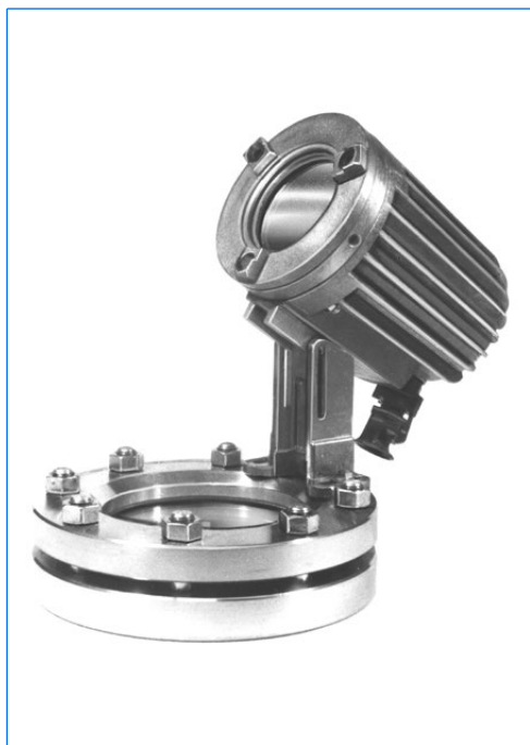
Hublot rond selon DIN 28120, DN 125, PN 10, avec verre en silicate de soude selon DIN 8902, avec projecteur CHEMLUX, type L 20 deH Sch, fixation par charnière.

Selon DIN EN 10204. Livrables sur demande contre facturation.