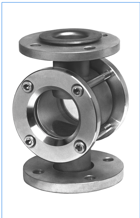
Contrôleur visuel de circulation, gamme FB-VA, type FB-VA 50