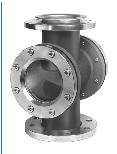
Contrôleur visuel de circulation, gamme FB-VA, type FB-VA 100