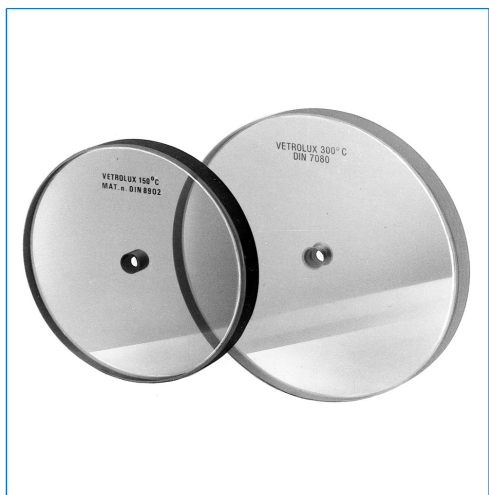
Verres ronds avec perçage central \varnothing 10,5 mm, similaires à DIN 8902 ou DIN 7080, pour essuie-glaces de la gamme W / WD.