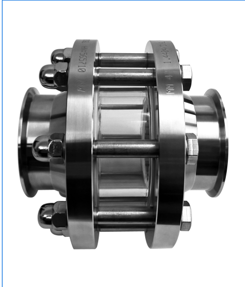
Contrôleur visuel de circulation, type DSP, avec connexions TriClamp®, 4"