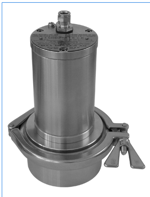
Projecteur type EdelEx STERI-LINE 20 dH, 24 V, 20 W, Ex d IIC T4 Gb, Ex t IIIC T130°C Db IP67, Ex II 2 G + D, sur hublot à verre moulé, DN 100