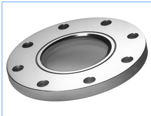
Bride à verre moulé, DN 150