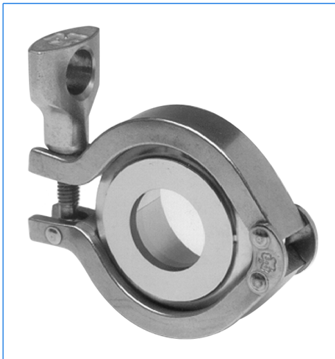
Hublot avec raccord Tri-clamp, type «Standard View» (SV)