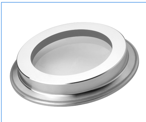
Hublot pour raccord Tri-clamp, type «Large View» (LV)