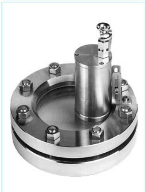
Proiettore tipo EdelEx 20 dH Sch K1, 20 W, 24 V, Ex d IIC T4 Gb, Ex t IIIC T130°C Db IP67, Ex II 2 G + D, con staffa di fissaggio «Sch» su oblò rotondo secondo DIN 28120, PN 10, DN 125.