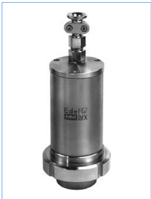
Proiettore tipo EdelEx 10 dH R50 K1, 10 W, 230 V, Ex d IIC T4 Gb, Ex t IIIC T130°C Db IP67, Ex II 2 G + D, con cartella di fissaggio «R» su oblò avvitato similare a DIN 11851, PN 6, DN 50.

Con la gamma EdelEx, MAX MÜLLER S.p.A., presenta il primo proiettore AD-PE in Europa interamente in acciaio inossidabile . Un prodotto efficiente che voi, costruttori o utilizzatori di apparecchi INOX avete atteso da anni! Messi da parte il suo design senza compromessi e la qualità rinomata dei prodotti di fabbricazione MAX MÜLLER S.p.A., i proiettori della gamma EdelEx vi offrono i principali seguenti vantaggi: