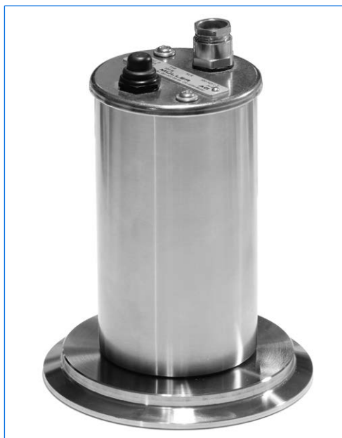
Proiettore tipo KLR 20 HDAsp, 20 W, 115 V, con pulsante incorporato «D», montato su un oblò con vetro sigillato per raccordi Triclamp, DN 100