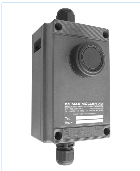
Temporizzatore tipo U3-230, cassetta in resina polyester, tensione di alimentazione 230 V AC