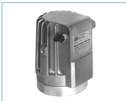
Tipo KL 20 HE sp, 20 W, 240 V, attrezzato con interruttore marcia-arresto «E»

Da più di 30 anni Max Müller S.p.A si preoccupa di “limitare la durata del collegamento” dei suoi proiettori, perchè ore di funzionamento inutili implicano maggiori costi di energia e riducono la durata delle lampadine con spese supplementari di manutenzione. Le soluzioni e le opzioni qui sotto sono a disposizione della nostra clientela (vedi tabella al verso):