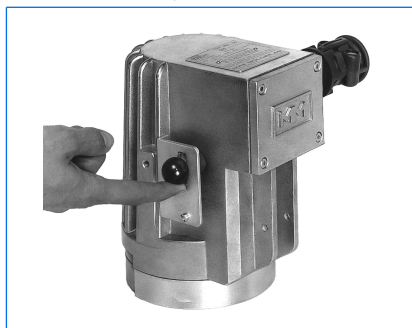
Tipo PEL 50 deHV, 50 W, 230 V, Ex d e IIC T4 Gb, Ex t IIIC T130°C Db IP67, Ex II 2 G + D, attrezzato con temporizzatore «V»