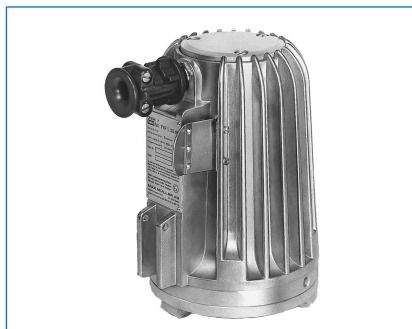
Tipo L 20 deHVsp, 20 W, 115 V, Ex d e IIC T5 Gb, Ex t IIIC T95°C Db IP67, Ex II 2 G + D, attrezzato con temporizzatore «V»