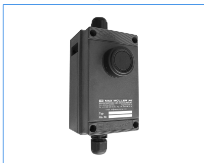
Temporizzatore per comando a distanza «U3», Ex d e IIC T6 Gb, Ex t IIIC T80°C Db, Ex II 2 G + D