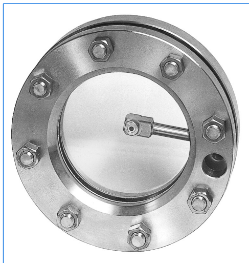
Lava vetro tipo SV 4, montato in un oblò similare a DIN 28120, DN 125, PN 6