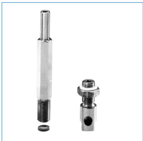
Lava vetro della serie SVS