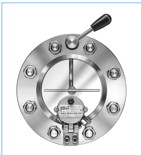
Tergicristallo, serie WS, montato in un oblò VETROLUX® secondo DIN 28120, DN 100, PN 10 con proiettore miniLUX®, tipo KVL 50 HDSch, 24 V, 50 W, in versione «vista ed illuminazione attraverso un oblò unico».