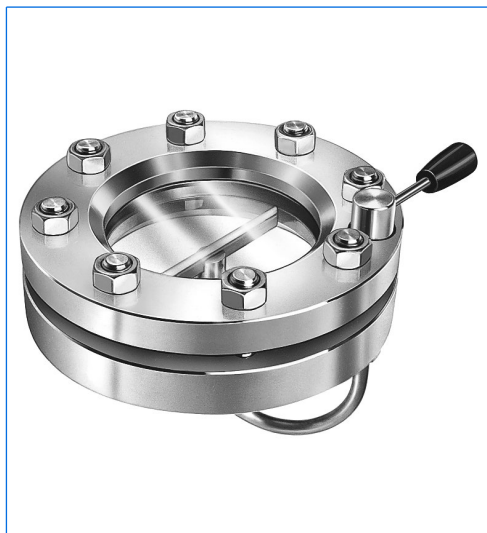
Tergicristallo, serie WS, montato in un oblò VETROLUX® secondo DIN 28120, DN 100, PN 10.

Serie WS con comando laterale per oblò rotondi secondo DIN 28120 o similari