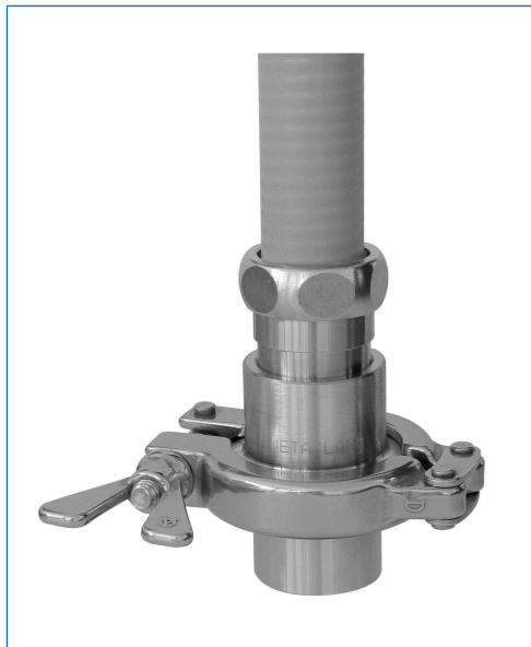
Oblò con vetro sigillato, 1", con fascio ottico montato del proiettore fibroLUX