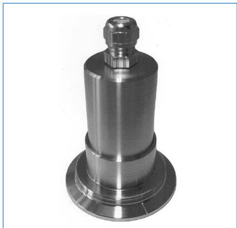
Micro-proiettore LED, tipo MVLR 2 LED, 2 W, 24 V AC/DC, montato su oblò con vetro sigillato per raccordi Triclamp®, DN 50, PN 16